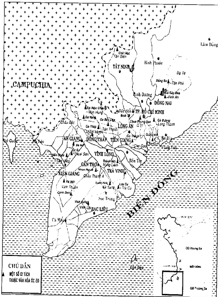
Bản đồ 2: Bản đồ phân bố các di tích văn hoá Óc Eo trên đất Nam Bộ

mang những yếu tố của văn hóa Phù Nam tức văn hóa Óc Eo. Các nhà khảo cổ học quốc tế cũng đã phát hiện một số di vật Óc Eo hay chịu ảnh hưởng văn hoá Óc Eo tại một số địa điểm trong phạm vi đế chế Phù Nam như ở Pong Tuk, U Thong vùng hạ lưu sông Ménam, vùng Chumpon gần eo Kra trên bán đảo Mã Lai... và coi đó là những yếu tố của văn hóa Phù Nam/văn hóa Óc Eo.