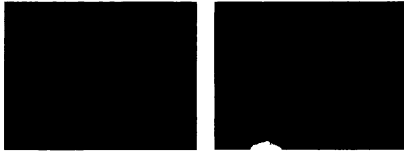
Hình 1. Kẹo dẻo từ dịch ép thịt quả cacao