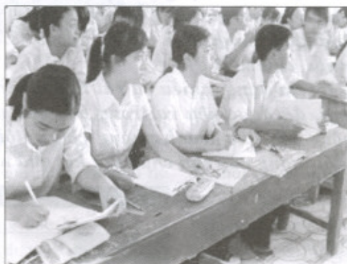
Cần tăng cường giáo dục pháp luật tại các trường học

Nhiều vụ việc tính chất rất nguy hiểm, phức tạp. Điển hình: Ngày 14/4/2008, tại Nhà nghỉ Hồng Hà, cơ quan chức năng bắt quả tang 29 đối tượng tổ chức sử dụng thuốc lắc. Hay vụ