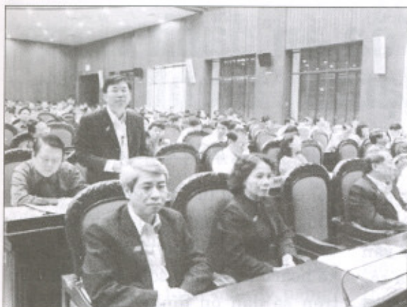
Các đại biểu QH rất lo ngại về thực trạng thanh thiếu niên vi phạm pháp luật