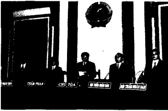
Hội đồng xét xử (ảnh minh họa)

Toà án cấp huyện; xét xử phúc thẩm thuộc thẩm quyền của Toà án cấp tỉnh. Như vậy, Toà án cấp tỉnh không có chức năng xét xử sơ thẩm và giám đốc thẩm, tái thẩm các vụ án dân sự, điều này góp phần tạo điều kiện nâng cao hiệu quả xét xử tại Toà án mỗi cấp. Đó cũng chính là chủ trương