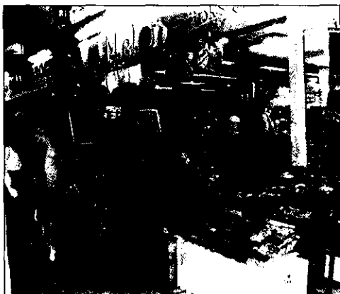
Khu chợ tập hợp nhiều người Việt Nam sinh sống.

khăn. Cái quỹ được vài chục triệu.. thế nhưng không làm vơi đi được một “định kiến” có sẵn trong lòng nhiều người Việt (cụ thể là người lái xe ôm, lái taxi, bán nước chè đưa cho anh bạn tôi tờ báo và mách anh vụ việc thảm khốc trên) về những anh chàng người Hàn độc thân. Và