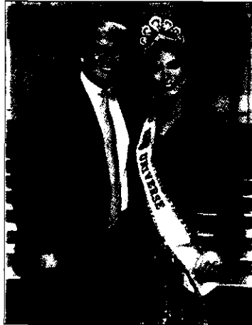
Đăng cai tổ chức tốt các cuộc thi Hoa hậu tâm quốc tế là một "kênh" quảng bá du lịch hiệu quả

Luật Du lịch quy định HDV cho khách nội địa cũng phải có thẻ hành nghề, và lại cho phép phạt tiền từ 2 đến 3 triệu đồng đối với người hướng dẫn khách du lịch mà không có thẻ. Chỉ được sử dụng HDV người VN, có thẻ để hướng dẫn khách du lịch nước ngoài. Trong khi đó, hiện nay VN chỉ có khoảng 5.750 HDV. Đây là con số quá ít để đáp ứng nhu cầu của thị trường. Thị trường khách Nhật Bản hiện đứng thứ ba với hơn 5 vạn lượt/năm, nhưng số HDV biết tiếng Nhật chỉ chiếm 8%.