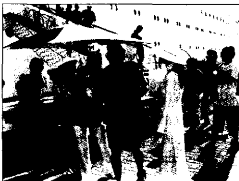
Đội ngũ hướng dẫn viên du lịch VN còn thiếu chuyên nghiệp

Những chiến dịch quảng bá hình ảnh Việt Nam trên các phương tiện thông tin đại chúng của các nước trên thế giới do Bộ