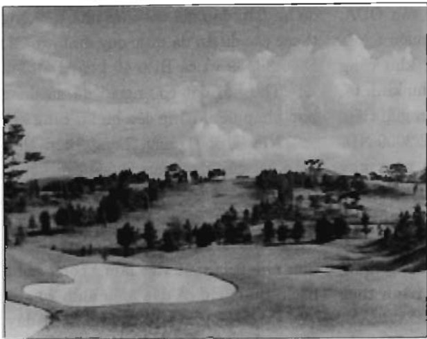
Những mảnh ruộng mà nông dân từng cấy lúa, sinh sống bỗng chốc biến thành sân golf.

chủ đầu tư không có năng lực; hay hàng loạt khu rừng đặc dụng, rừng phòng hộ bị tàn phá nặng nề khi chuyển đổi mục đích sử dụng.